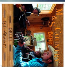
M.S. Country Band